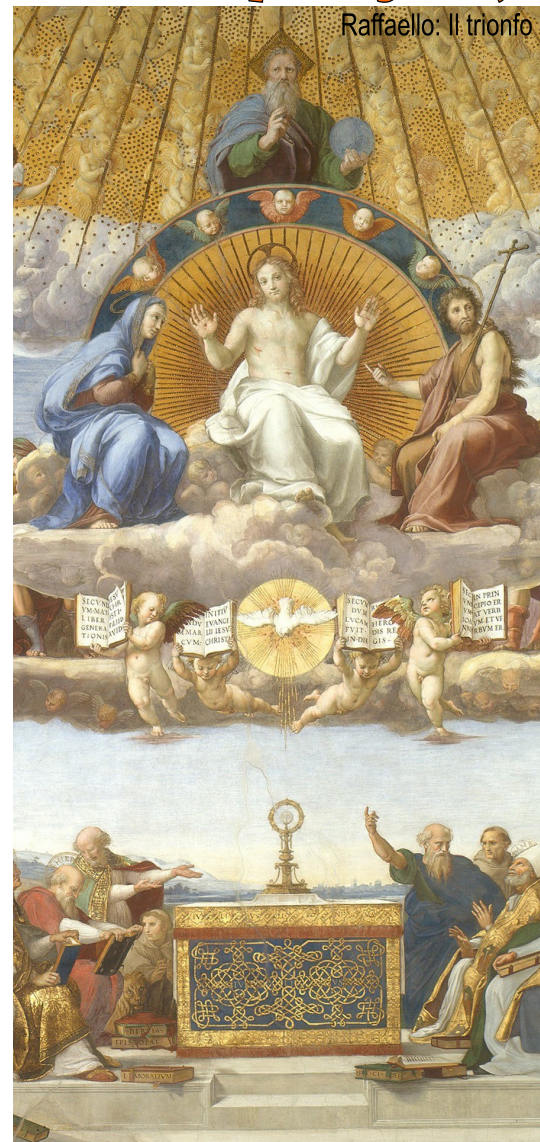
Raffaello: Il trionfo dell'Eucaristia (La disputa sul Sacramento)

"Pane dei pellegrini, vero pane dei figli"